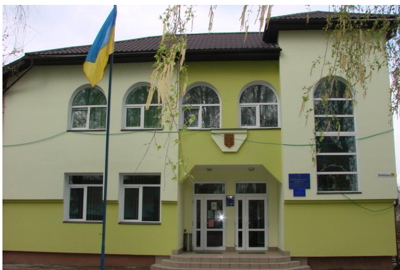
Новозбудоване приміщення сільської ради

За історичними даними з 1865р. діє церква Святого Архистратига Михаїла.