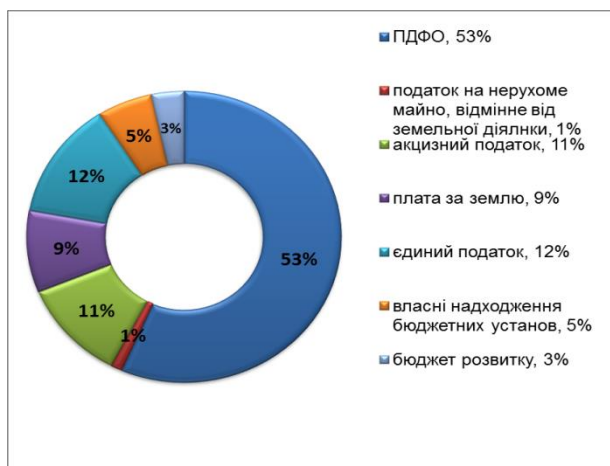
Структура найбільших податків власних надходжень міського бюджету

Власних доходів загального та спеціального фондів надійшло 673,3 млн.грн., що становить 113,5% до плану на 9 м. 2016 року та 140% до надходжень за 9 м. 2015 року.