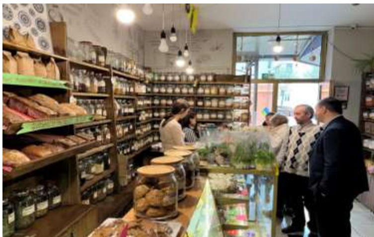
- магазин корисних продуктів "Кошик здоров'я"

А також незвичайний бізнесовий об'єкт - особливе підприємство УТОС, навчально-виробниче підприємство незрячих. Йдеться не про гроші чи успішні проекти, а соціальне підприємництво, яке в Івано-Франківську необхідно розвивати. Наразі тут виготовляють та реалізують картонну продукцію, зокрема папки та швидкозшивачі.